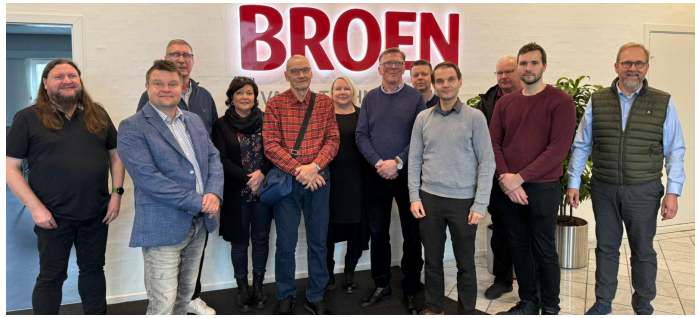
Kuva ja teksti: Johanna Satumäki, VantaLVI

Onneksi meillä oli Kööpenhaminassa aikaa upealle illalliselle, kaupunkikävelyille ja paikallisten nähtävyyksien katseluun. Iloisina, vatsat ja poskilihakset naurusta kipeytyneinä paluumatka kotiin sujui nopeasti ja vaivattomasti. Olipa kivaa! Iso kiitos suomalaisille ja tanskalaisille isännillemme vieraanvaraisuudesta ja arvokkaasta ajastanne.